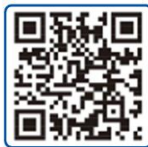
中国研究生招生信息网

我院博士研究生招生采用“申请 - 考核”制方式, 主要包括申请资格审核和综合考核。申请阶段需要提交的材料: 学习经历和学位、外语水平、科研经历和成果、研究计划等。综合考核阶段主要为面试, 具体要求以我校研究生院网站公布的当年博士研究生招生简章为准。